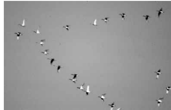
Sträckande bläsänder och stjärtänder över Vättern

Abisko. Både vid Vidablick och Abisko sågs 2 kustlabbar och det rörde sig nog om minst 3 individer. Minst 2 pilgrimsfalkar drog förbi Vidablick och en silltrut sträckte mot söder vid Abisko. Det förväntade sträcket av änder kom av sig och endast 240 bläsänder sträckte mot S denna dag. Totalt passerade 3700 rovfåglar, sjöfåglar och ringduva södra Vättern denna fredag, där tranor stod för 25 % av sträcket.