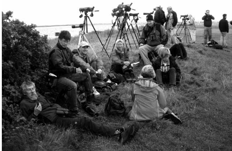
En paus efter ett intensivt skådande efter sträckande fåglar nere vid Nabben

Vi har haft en underbar resa, känt oss välkomna och blivit väl omhändertagna. Tänk på en sak; vi som nybörjare får många fler kryss.