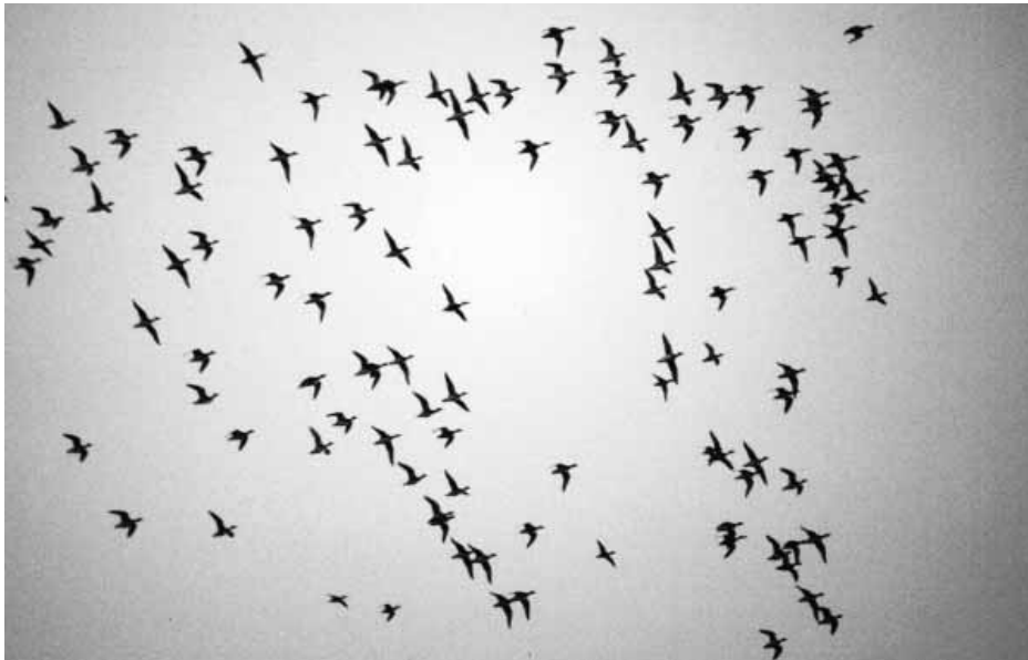
Sträckande änder över Vättern

eftersom morgonen fortskred. Peter Berglin kom och böt av Daniel och Per. Under några timmar på för- och eftermiddagen passerade inte mindre än 451 ormvråkar södra Vättern. De flesta kom från Bymarkshället och drog mot SO. Det var ju nästan som en bra rovfågeldag vid Falsterbo. Samtidigt sträckte 942 tranor mot söder på Huskvarnasidan. Dessutom passerade under dagen 340 prutgäss tillsammans med 45 vitkindade gäss och 210 grågäss samt en snögås genom södra Vättern. En flock på 15 dvärgmåsar sträckte mot S vid Vidablick för att en stund senare passera mot S över