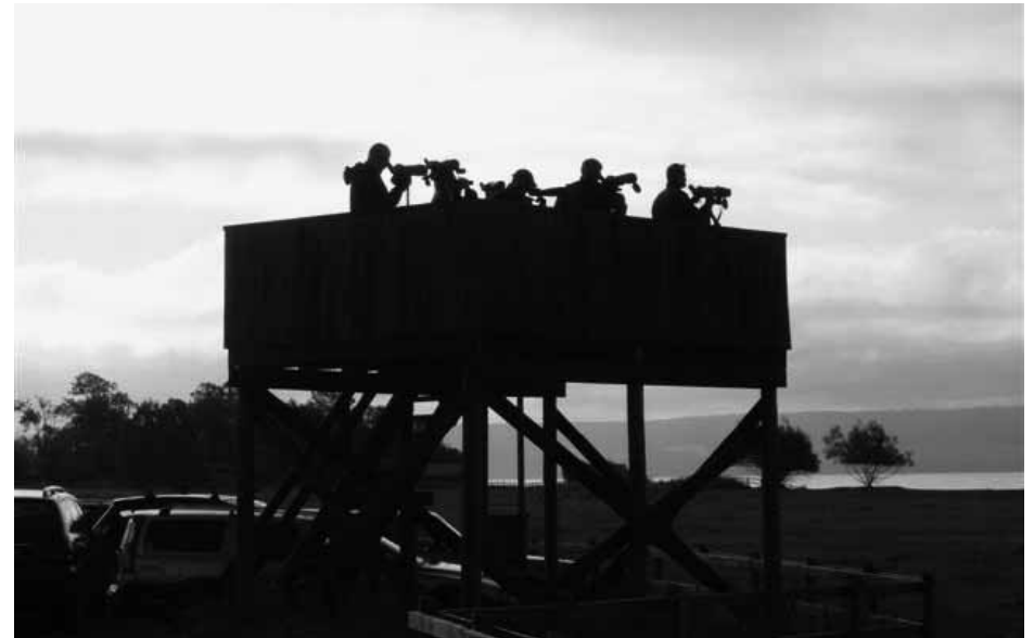
På spaning efter vadare över Erstadkärret.